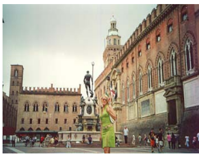
Piazza Maggiore e il Nettuno

Dal 29/12 al 3/1 , 6 Giorni €675 Mostra "Annibale Carracci" CAPODANNO a BOLOGNA " La Dotta, La Grassa " FERRARA, MODENA, REGGIO E. e... FERRARI! All'iscriz. €250 - Saldo entro il 10 Dic. - Singola €125 Costo per minimo 45 Partecipanti ( o più 20 Euro ); Ragazzi €575